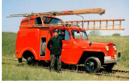
SBB P 77903