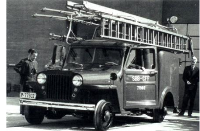
SBB P 77902

SBB P 77902 und SBB P 92981 Willys Overland , mit Aufbau für Fahrleitungsunterhalt. * Beide Fahrzeuge konnten durch Tauschen der Räder sowohl auf der Strasse- und Schiene fahren. Mit einem Spezial 2 Achs Anhänger konnte der Rollleiterwagen auf der Strasse zum Einsatz transportiert werden. FRIHO Spezialmodell in gemischt Bauweise mit 2 Achs Antrieb oder als Standmodell. Nur für 2L = DC erhältlich.