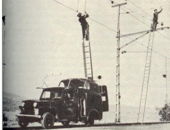
SBB CFF P 7025

** Die SBB Lgms Version wird nur auf Bestellung hin realisiert.