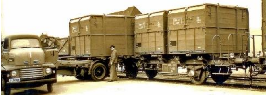
SBB Ob Tragwagen für NS oder pa Behälter ca. 1950